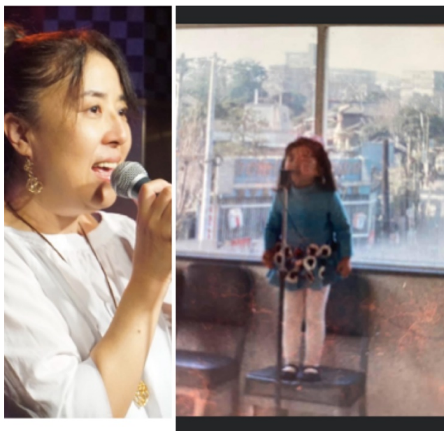
マイクを持つ私、昔と今

無線を始める前までは、仕事をずっとしていましたが、そろそろ子育ても卒業したので、私も一緒に仕事から卒業し、現在は家事と趣味の生活です。どっぷり昭和の時代に、私は東京で営業マンの父と洋裁を仕事とする母の間に産まれた一人娘。子供のころから、家には足踏みオルガン、ステレオがあり、音がたくさある家庭で育ったせいか、歌が大好きな子供時代を過ごしました。音楽と言えば洋楽をイメージする方が多いのかも知れませんが、私の場合は昭和の歌謡曲で育ったといっても過言ではありません。毎日のように、マイクに見立てたサインペンを持ち、歌っていました。